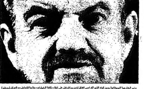
وزير الخارجية البريطاني رونك كوك الذي أكد اتفاق لندن واشتن على ابقاء الخيارات، متاحة للتصالح مع العراق

بغداد - فرحات عبيد الله... (The text features a statement from an Iraqi official regarding the country's stance towards the US.)